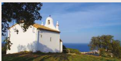
Notre-Dame de la Salette, sur les hauteurs de Banyuls-sur-Mer

chênes verts et des chênes liège, d'une architecture très simple et d'une blancheur étincelante, elle évoque les villages méditerranéens des îles grecques et de l'Andalousie. Chaque année, le second dimanche de septembre, une foule de pèlerins gravit le sentier pentu qui y mène.