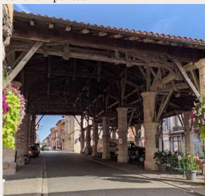
La halle de Gimont

charpente en chêne couvre quelque 1 000 mètres carrés avec un toit en tuiles canal à 4 pentes.