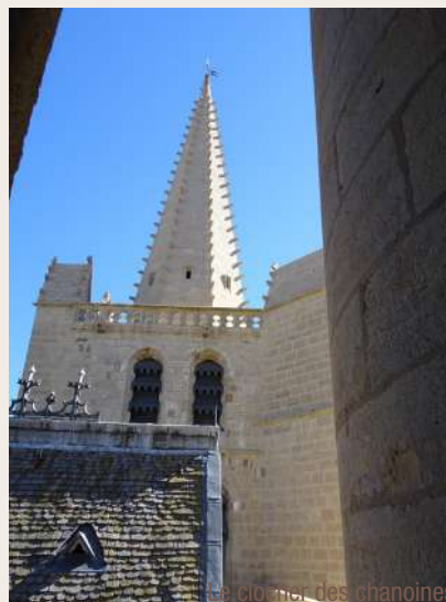
Le clocher des chanoines

plus simplement entre 1599 et 1629. La rosace construite en 1606 vit ses vitraux détruits à la Révolution et remplacés en 1931. Les stalles de noyer, furent exécutées par des mendois en 1692 à la demande de Mgr de Piencourt. La cathédrale renferme aussi des tapisseries d'Aubusson du début du XVIII e siècle ainsi que des orgues réalisées en 1653.